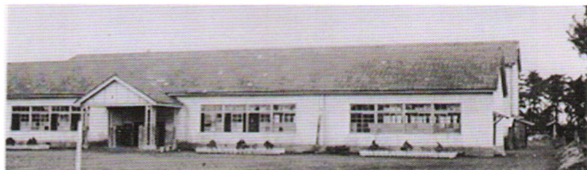
当時の竜ヶ崎教場