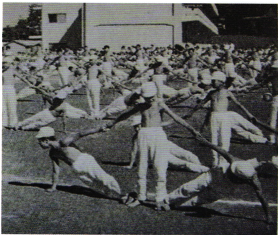
昭和38年体育館の予定地での体育祭