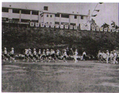
東京オリンピック記念運動会 (昭和39年)