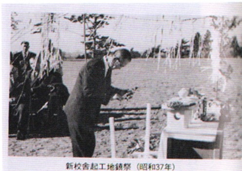
新校舎起工地鎮祭 (昭和37年)