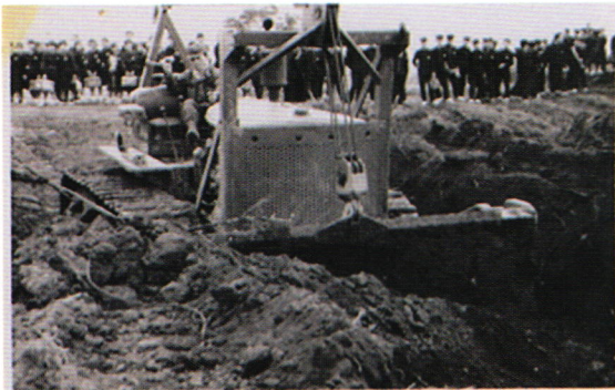
生徒達が造成作業を見学している様子