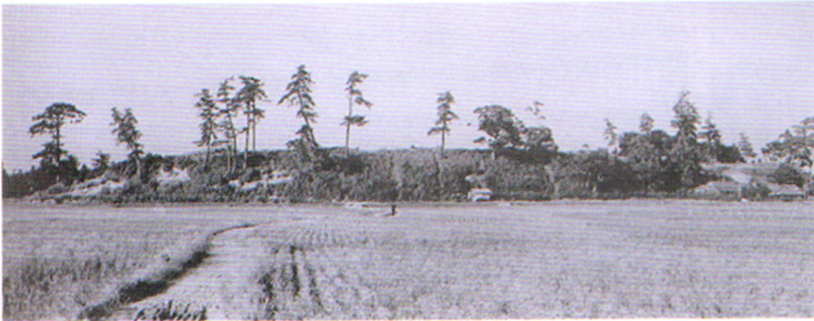
造成前の愛宕山の風景

愛宕神社のある市民の憩いの場所で、椎の古木と樹齢数百年を数える松の巨木が亭々と立ち並び、この台地から竜ヶ崎の町並みが一望され、果てしなく続く田園風景など心休まる景勝の地に新校舎の建設が決まり、昭和38年、愛宕中竜ヶ崎教場の生徒が新校舎に移転しました。また、校舎の敷地と運動場の高低差があるため中段運動場が整備され、創立記念日を11月4日に決定されたのもこの年でした。