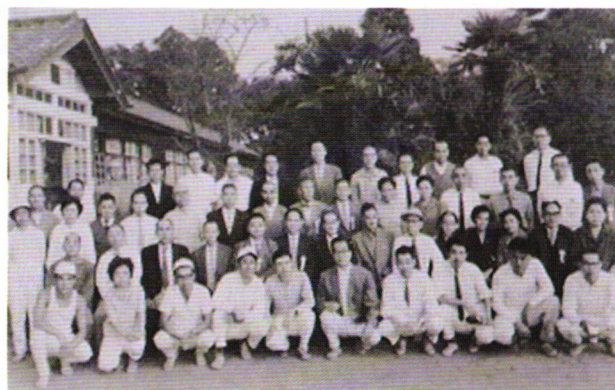
馴柴教場職員・PTA役員