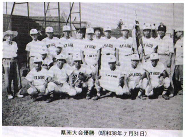
県南大会優勝(昭和38年7月31日)