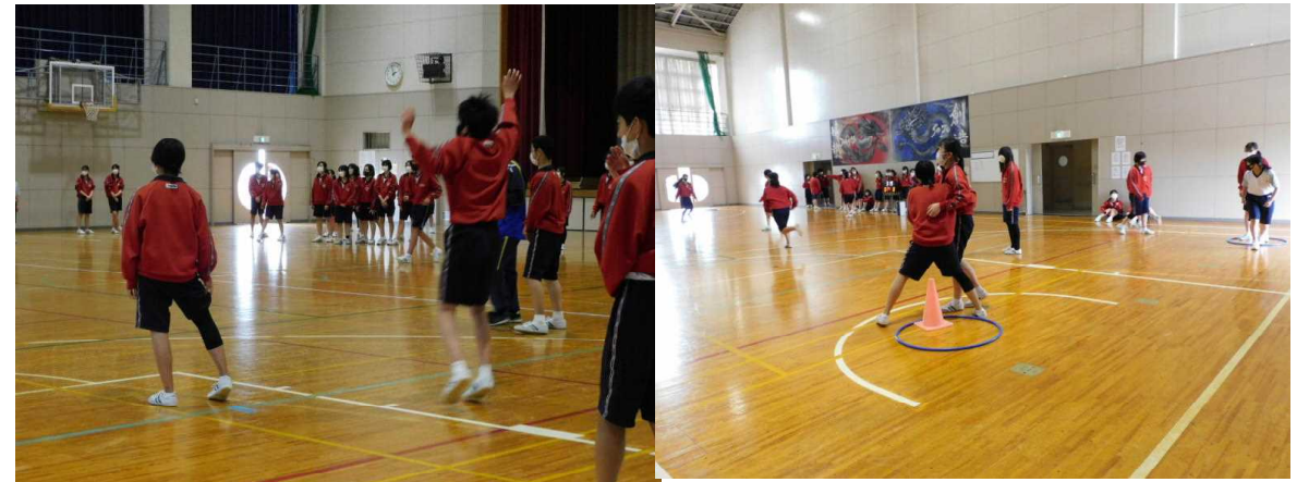
学年生徒会が企画したレク、スポーツ鬼ごっこドッジボールをみんなで楽しみました！