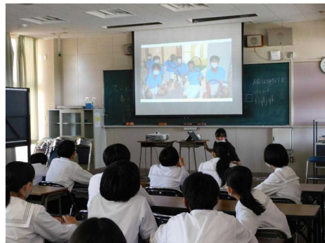
先生がつくってくれた応援動画をみんなで鑑賞。