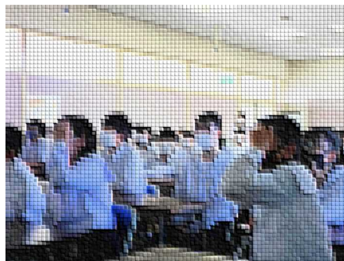
懐かし〜い! あんなこともあったね。