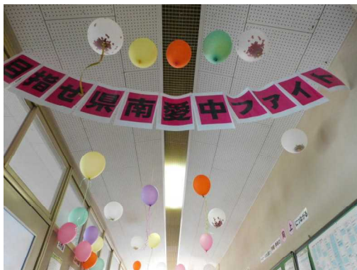
2階廊下を飾り付けました。

団体戦の結果です。どの部も県南大会出場目指して、一所懸命に取り組みました。「最後の総体」は対戦相手がいるからこそ、そして一緒にプレーしてくれる2年生がいるからこそ、出場できる総体でした。「この仲間と一緒に県南大会に出場したい」一人一人がというプレッシャーを感じながら、輝く姿が見られました。「チーム愛宕」として、どの部活動も頑張りました。県南大会(6/29~7/4)に向けて、「龍ヶ崎市の代表」という立場を理解し、おごることなく練習に取り組んでいってほしいと思います。