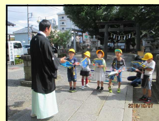
【地域の寺院の調査】

インタビューの仕方やメモの取り方など国語科との関連を図りながら学習を進めていきます。自分たちで計画を立て、見学し、まとめる（伝える）という学習の仕方を身に付けさせると共に、ICT機器なども有効に活用していきます。コース別の活動となり、約束や役割の大切さにも気付かせます。