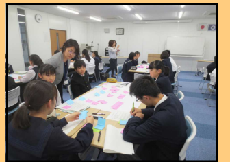
【各中学校の代表による話し合い】