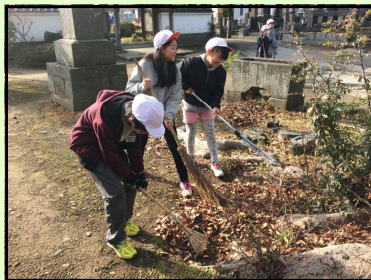
【近くの寺院の清掃活動】