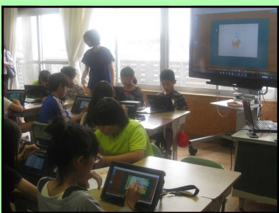
【ICT機器を活用した授業】