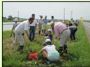
【地域の方との球根植え】