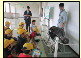
【クリーンプラザ龍の見学】

市の施設である「浄水場」や「クリーンプラザ・龍」を見学してきます。これまでの見学や体験活動から、「知りたいこと」についてどうすればよいかを考えさせます。市の各施設を見学し、自分たちの市を誇りに思えるような声かけをし、市民として自分たちにできることを考えさせていきます。