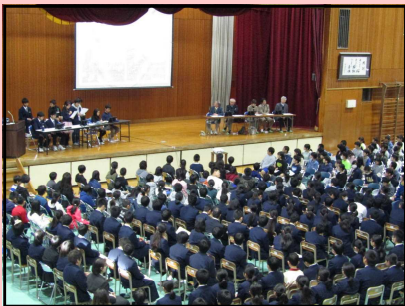
【龍の子フォーラム】

9年間を見通したキャリア教育（※1）、シティズンシップ教育（※2）を推進していきます。