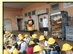
【スーパーマーケット見学】

「わたしのまちみんなのまち」での活動を振り返りながら、より主体的な学習になるようにしていきます。学校を離れ、自分たちが普段から慣れ親しんでいる場での見学では、約束だけでなくマナーの大切さも学習していきます。