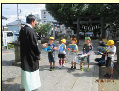
【地域の観察や調査】