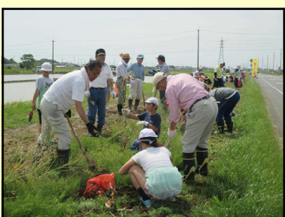
【地域との交流（球根植え）】