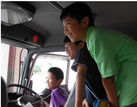
消防車の中にも入れてもらいました。