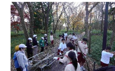
蛇沼清掃(小中合同)