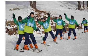
1年 スキー宿泊学習