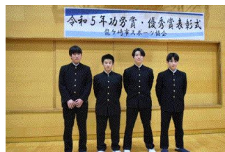
クラブチーム(野球)