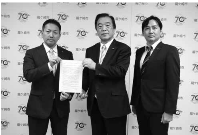
▲萩原市長(左)に「あき地に繁茂した雑草等の除去に関する条例への代執行の規定についての要望書」を提出しました

令和5年12月より、議会改革ワーキングチームにおいて、管理不全に陥っている土地の対策について検討を行ってまいりました。