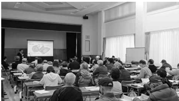
▲令和5年度議会報告会・意見交換会の様子 (馴柴コミュニティセンター)