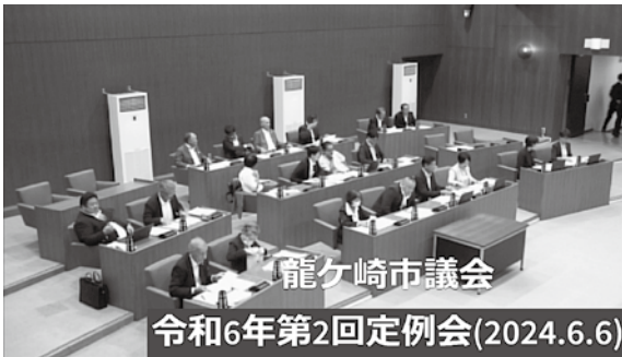
▲ Youtube の動画配信のイメージ