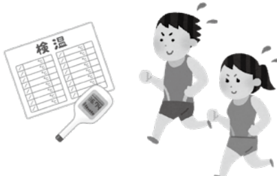
▲新型コロナウイルス対策を万全に！

健康づくり推進部長 ランナーにおいては、大会1週間前の体調管理チェックシートの提出を義務付け、感染疑いのある方の来場規制にて会場にウイルスを持ち込まない対策を行います。また、様々な場面で3密にならないよう場面を作らない工夫と、それに対する理解と協力を求めます。観戦及び応援者に対して