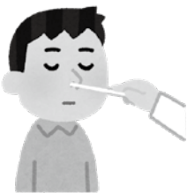
▲自費でのPCR検査等費用の一部を助成