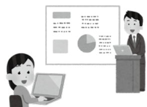
▲ICT導入には持続可能な仕組みづくりの構築が必要

教育長 最新の技術、知識を有するICT支援員をこれまで以上に有効活用し、発信する時期、内容、方法についても研究