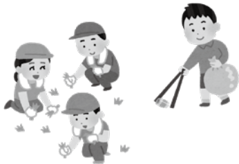
▲状況にあわせて市民活動の再開を！

再開の指針にしていたなければと思います。その為に、現在は他の組織の活動事例を知る機会が少ないので、コミュニケーションセンター間で活動事例を紹介しあう場を作り、情報の共有化を進めていきたいと思っています。議員 再開するための道筋が見えなければ活動は停滞してしまい、今後の市民活動に負の要因だけが残ってしまいます。前進しながら成功事例を積み重ねていただければと思います。