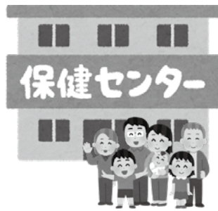
▲新保健福祉施設が整備されます

とを前提にして、予算には賛同したいと思えますので、このことを深く受けとめていただこうお願いします。