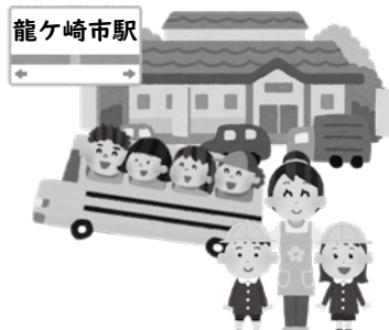
▲駅前子どもステーションは機能と収支のバランスを

委員 工業団地拡張事業において、用地の買収価格、分譲価格、判断基準の算出根拠について伺います。 商工観光課長 用地の買収価格は、接道や地形等により、1㎡当たり3490円から5450円です。分譲価格は、1㎡当たりA区画が1万7300円、B・C区画が1万7100円です。なお、不動産鑑定士による不動産鑑定評価を参考に、公共用地等計画連絡調整会議に諮った結果、鑑定評価額が妥当と判断されたことをもって、価格を決定しています。