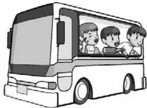
▲春と秋に大型バスの増便を

議員 市には108台の公用車がありますが、中でも市民にとって一番身近で、大変人気のある大型バス、中型バス、小型バスの年間利用状況についてお聞かせください。 総合政策部長 昨年度の運行実績で、大型バスが143回、中型バスが138回、小型バスが127回の運行です。 議員 どのような方が利用されていますか。 総合政策部長 各地区の長寿会や地域コミュニティ協議会、各種市民団体のほか、小中学校の校外学習やプール授業に伴う児童・生徒の送迎等を中心に利用されています。 議員 地域の皆さんから「なかなかバスが借りられない。何とかならないか」という声を、毎年お聞きします。私からの要望ですが、春先から秋の紅葉の時期に大型バスを増便することはできないでしょうか。 総合政策部長 季節によつては、予約が集中することもありますが、民間バスの借り上げによる対応や日程調整をお願いする状況もあります。子どもにも大人にも優しい龍ヶ崎市と言われるよう、がんばりたいと思います。