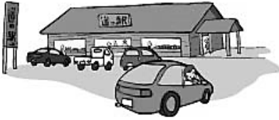
▲「道の駅」待った！財政健全化に 取り組むから大丈夫では本末転倒！

市長 実際の財政運営において、この収支不足が毎年度歳入確保や歳出削減等の財政健全化の取り組みにより解消し、基金繰入に過度な依存をすることのない様に務めていくことは申し上げるまでもないことです。