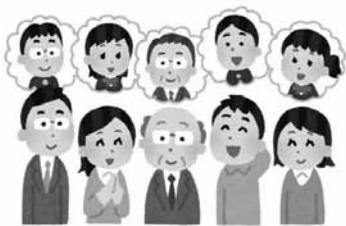
▲先生を囲んだ同窓会 若者よ同窓会で盛り上がろう！

議員 地方創生の一環で、茨城県内でも30歳同窓会に補助を出している自治体があります。最近の30歳は晩婚化で結婚が遅れ、両親の高齢化により首都