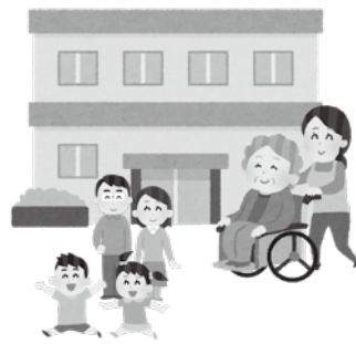
▲公募により決定した法人に補助金を交付しました！

開設時期は令和4年度中の予定になっており、同法人が運営する特別養護老人ホームリカステの敷地内に新たに整備されます。