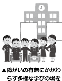
▲障がいの有無にかかわらず多様な学びの場を

議員 当市におけるインクルーシブ教育について、市長の考えを伺います。 市長 障がいの有無にかかわらず、全ての子どもたちが共に学び合う中で、社会の構成員として基礎をつくる事ができるようなことに。特別な支援を必要とする子どもたちが必要とする子どもたちがその能力や可能性を最大限に伸ばして、自立し、社会参加することができるようになること。さらには、地域社会で積極的に活動し、その一員として豊かに生きることができるようになること。これらのこ