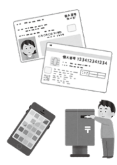
▲オンラインや郵送での申請も行っています

また、直近3か月の申請件数は、令和4年11月に2419件、同年12月に4274件、令和5年1月に1746件となっております。