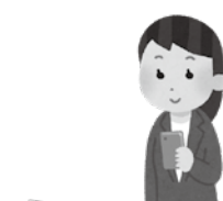
▲スマートフォン等を用いて申請が可能に

り出産育児一時金の額が引き上げられることから、本条例で定める出産育児一時金の額について、同様の改正を行うものです。 ◆議案第15号 龍ヶ崎市印鑑条例の一部を改正する条例について 印鑑証明書の交付申請手続について、スマートフォン等を用いた申請が可能となるよう、所要の改正を行うものです。 ◆議案第16号 龍ヶ崎市と茨城県信用保証協会との損失補償金寄託契約に基づく回収金の返還を受ける権利の放棄に関する条例の一部を改正する条例について 本条例に基づき、中小企業等の事業の再生の促進を目的に、市が茨城県信用保証協会に対し損失補償を行った場合に生じる回収金の返還を受ける権利の放棄に関し、その条件となる事項に係る根拠法令について、法律の制定、廃止に伴う修正を行い、新たに対象となる計画の追加を行うため、改正を行うものです。