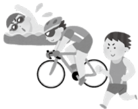
▲大学があるという財産を活用したまちづくりを！

市長 流通経済大学は、龍ヶ崎にとつて共に歩み、共に成長していく、かけがえのないパートナーです。公約の一つに流通経済大学との地域連携交流による健康長寿を掲げていることもあり、大学との