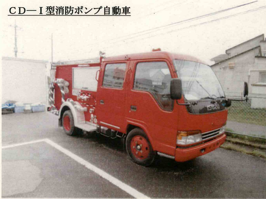
CD-I型消防ポンプ自動車