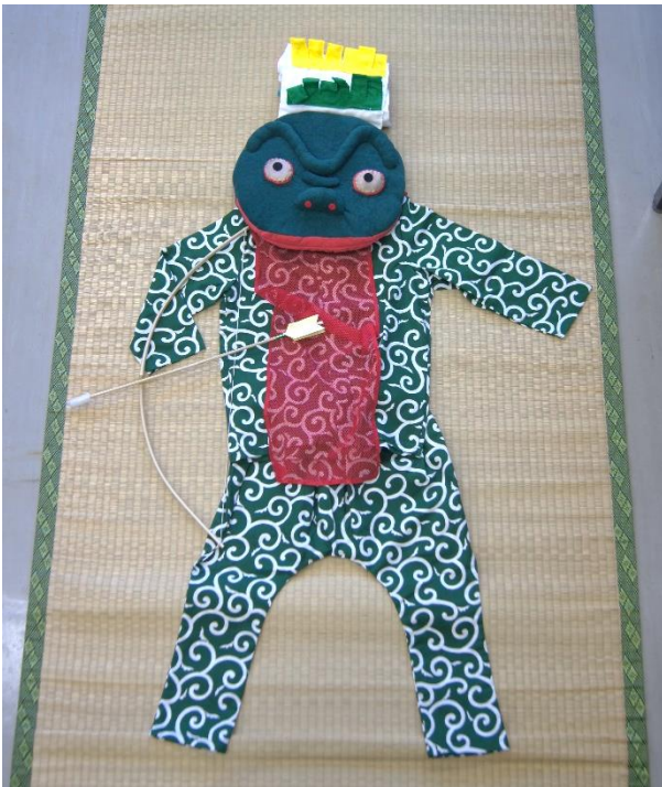
舞男衣装セット例