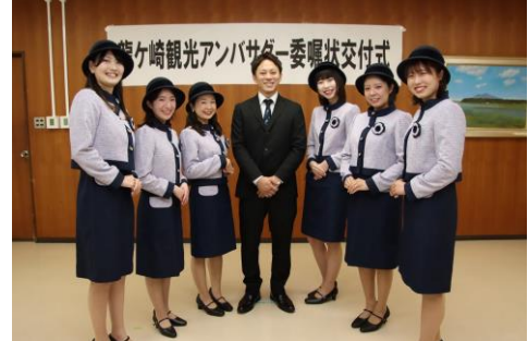
▲ 龍ヶ崎観光アンバサダー委嘱状交付式 （令和5年4月実施後の集合写真）

龍ヶ崎観光アンバサダーは、龍ヶ崎市の認知度向上やPR活動を実施。また、本市観光物産協会が主催するイベントや観光キャンペーンなどにも参加する予定です。