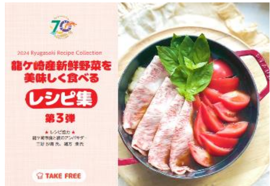
▲ A5判で制作したレシピ集

本市では、龍ケ崎産野菜の魅力をさらにPRできるように、たつのご産直市場やコミュニティセンターをはじめ、今後開催予定のイベントや出張販売などで配布を行う予定です。