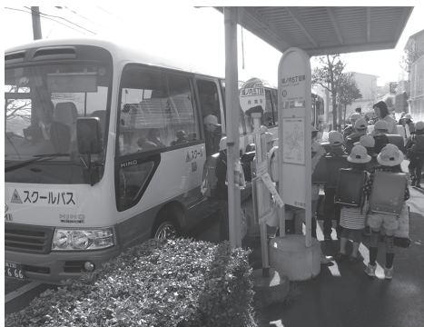
スクールバスで通学する長戸地区の児童

長戸小学校と城ノ内小学校が統合し、4月から新しい城ノ内小学校の一步を踏み出しました。統合後の児童数は525人となりました。