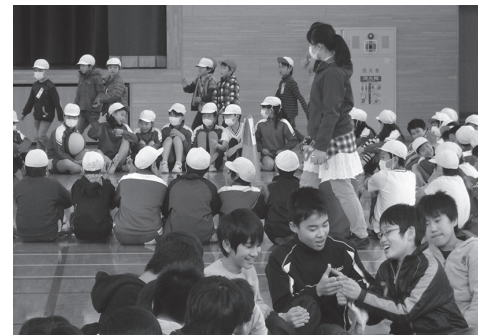
長戸小・城ノ内小交流会