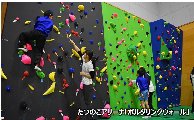
たつのごアリーナ「ボルダリングウォール」