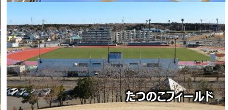
たつのごフィールド