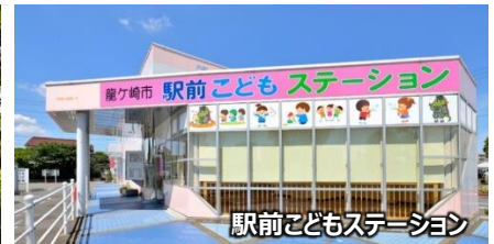
駅前子どもステーション