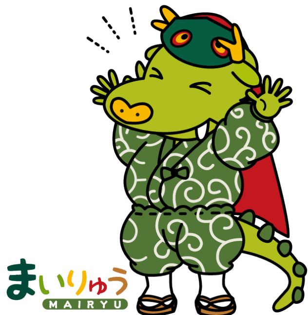
龍ヶ崎市マスコットキャラクター