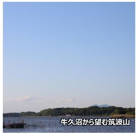
牛久沼から望む筑波山