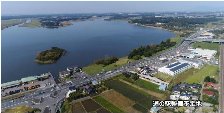
道の駅整備予定地