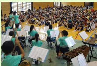
【小学校での吹奏楽コンサート】

実行委員を中心に運営する力を育てていきます。クラス合唱ではリーダーを育成していきます